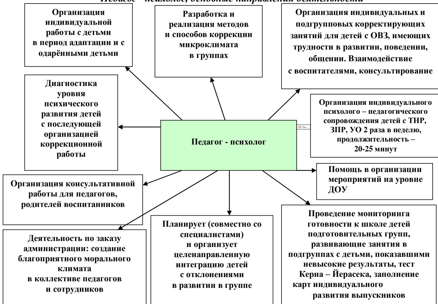
Рис. 2 «Педагог - психолог, основные направления деятельности»