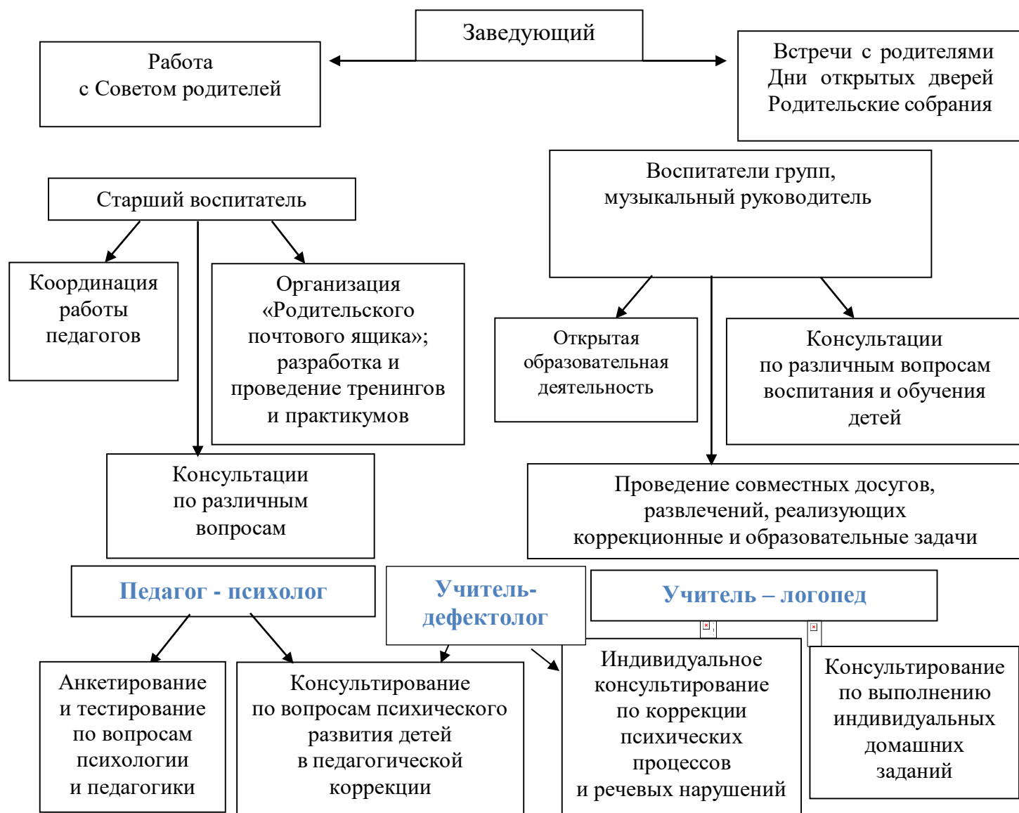
Рис. 1 «Схема взаимодействия с семьями воспитанников»